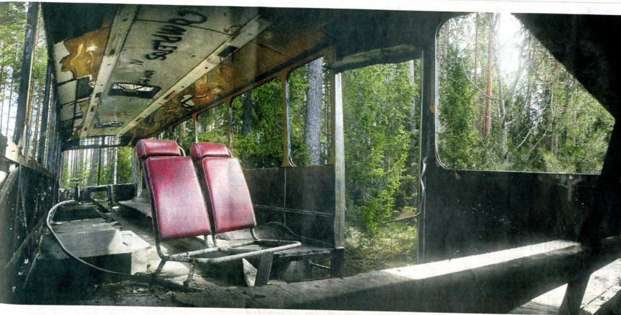
Joku on nähnyt vaivaa täysimittaisen linja-auto kuljettamiseksi metsäiselle päätepysäkillä. Ikkunoista avautuva maisema muuttuu yhä, mutt nälön rauhallisemmiksi kuin se on ollut.