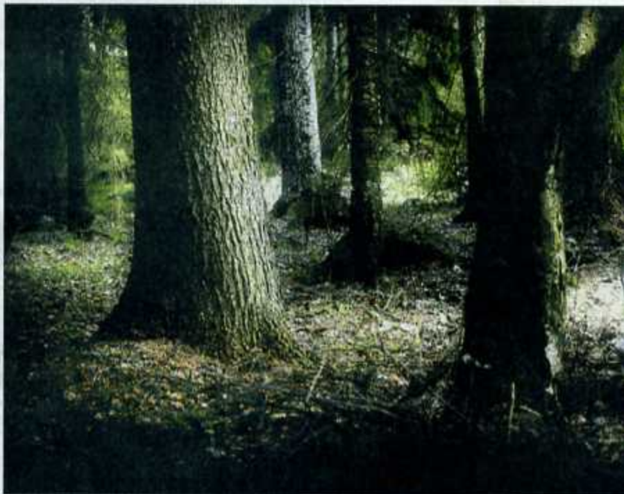
Pysäköintiäika täältä ikuisuuteen. II